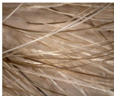
Sistema di infoltimento